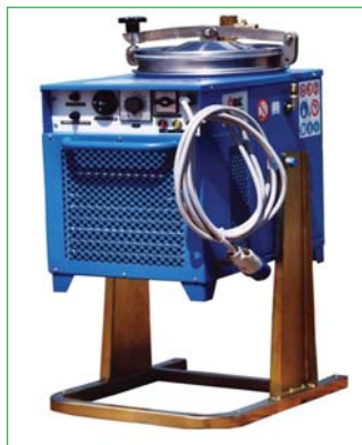
Рис. 3. Установка регенерации растворителей модели BS-550.

Эксплуатация моечной машины и установки регенерации одновременно позволяет свести практически к нулю потери растворителя. Мойка деталей производится в герметичной зоне, отработанный растворитель сливается в бак с крышкой, в которой есть специальное отверстие для сливного шланга, затем этот бак помещается в установку регенерации, полученный чистый растворитель опять подается на мойку. В результате получается замкнутая система, которая позволяет несколько раз использовать один и тот же объем растворителя. Это решает проблему утилизации, резко снижает концентрацию органических