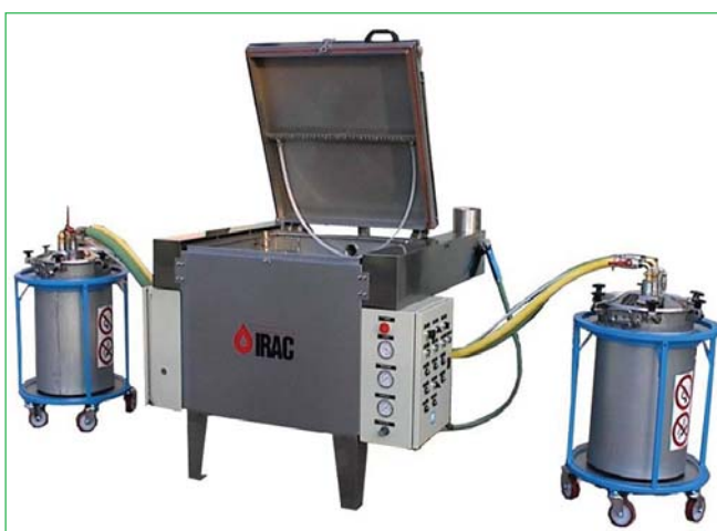
Рис. 5. Моечная машина серии LP 60/30, работающая в едином цикле с установкой AV-30

паров в воздухе помещения. Все моечное оборудование снабжено вытяжными системами, при открытии емкости после промывки деталей запаха растворителя не чувствуется.