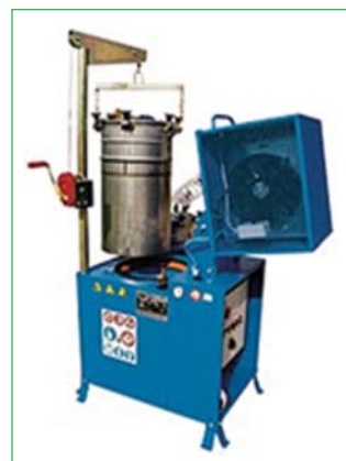
Рис. 1. Установка регенерации растворителей модели AV-70

Дистилляция на установке серии AV ведется циклически, так как она оборудована сменным баком-испарителем. После окончания цикла отгонки горячий бак с кубовым остатком извлекают и охлаждают, а на его место устанавливают второй бак с очередной порцией загрязненного растворителя. Специальный термостойкий прозрачный пакет, вложенный в бак-испаритель, позволяет легко удалять кубовый остаток. Использование термостойких пакетов намного облегчает эксплуатацию установок, так как большой проблемой является очищение поверхности от пригоревшего кубового остатка.