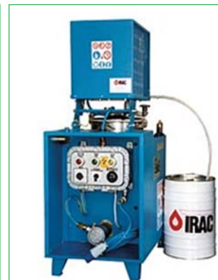
Рис. 4. Установка регенерации растворителей модели AV-30